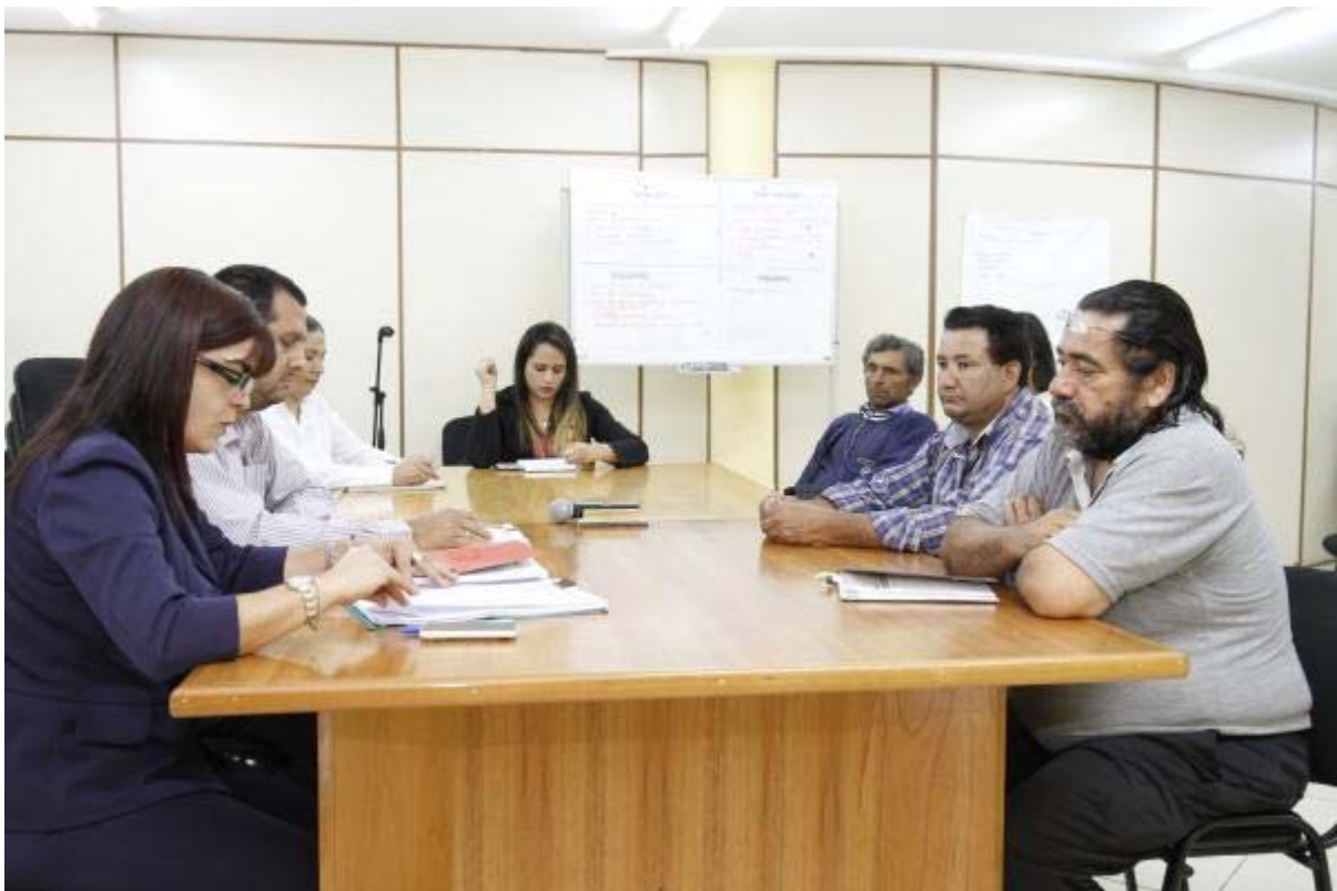
Programa de Asistencia a Pescadores entregó lista de Pescadores a Gremios con observaciones. NOVIEMBRE/2016