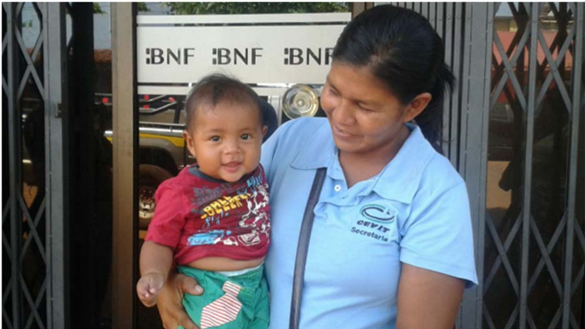
Son habilitadas las entregas de las TMC de Tekoporã en la modalidad Ventanilla. NOVIEMBRE/2016.