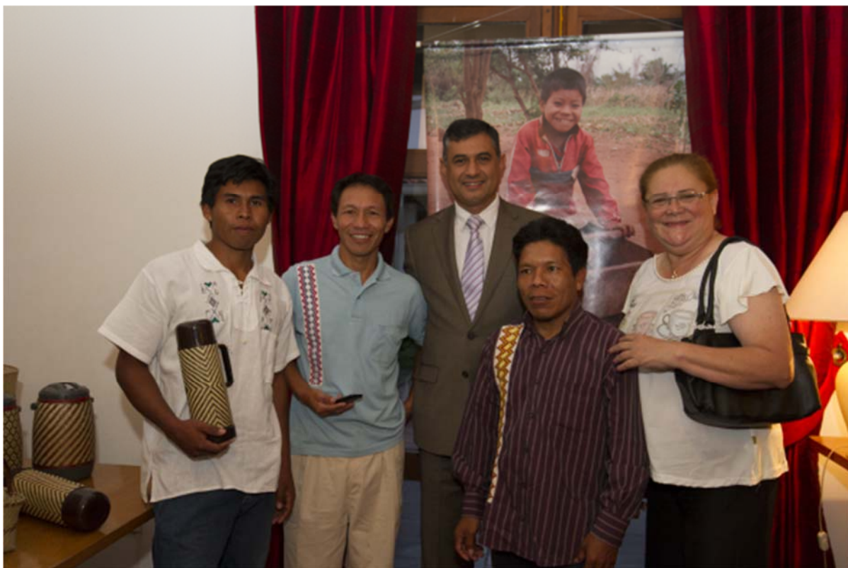
Exposición de Arte y Artesanía Mbya, participantes del Programa Tekoporã en el evento Mba'e porãete. NOVIEMBRE 2016