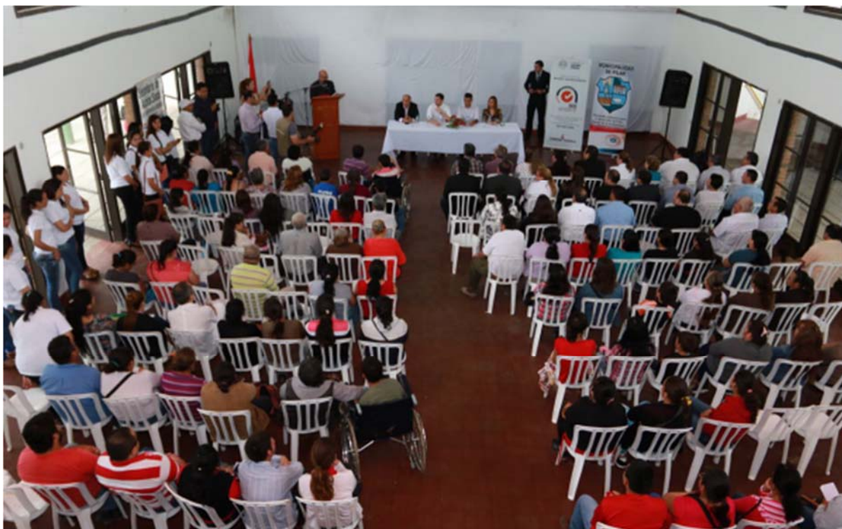
Acto de inclusión de nuevas familias participantes del Programa Tekoporã del departamento de Ñeembucú. NOVIEMBRE/2016