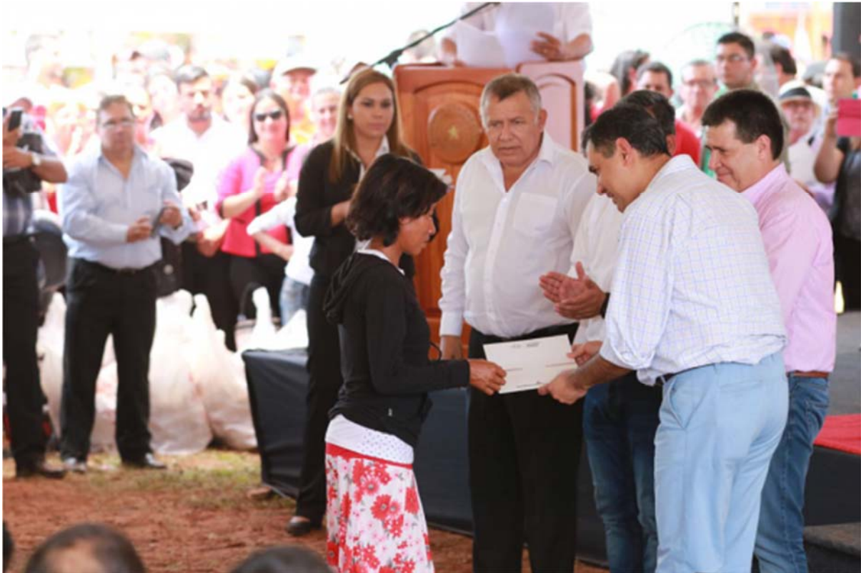
Nuevos contratos de inmuebles en el Programa TEKOKA en los Dpto. de Concepción y San Pedro. NOVIEMBRE/2016.