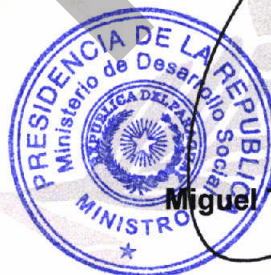
Miguel Tadeo Rojas Meza Ministro

Con la seguridad de contar con su apoyo a este programa que busca resolver el inmenso problema de la tenencia de tierra para compatriotas en situación de pobreza y extrema pobreza, me es grato saludarlo cordialmente.